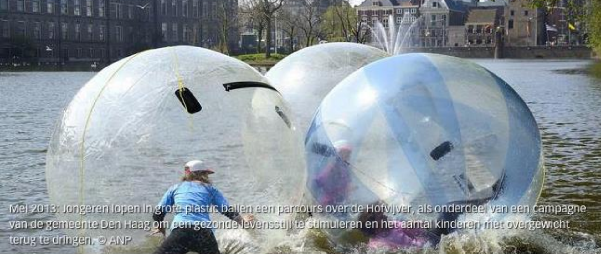
Mei 2013: Jongeren lopen in grote plastic ballen een parcours over de Hofvijver, als onderdeel van een campagne van de gemeente Den Haag om een gezonde levensstijl te stimuleren en het aantal kinderen met overgewicht terug te dringen.